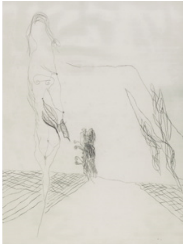
Gerhard Altenbourg »Eva«, 1957, Pitt-Kreide auf Papier, 92 x 66,5 cm