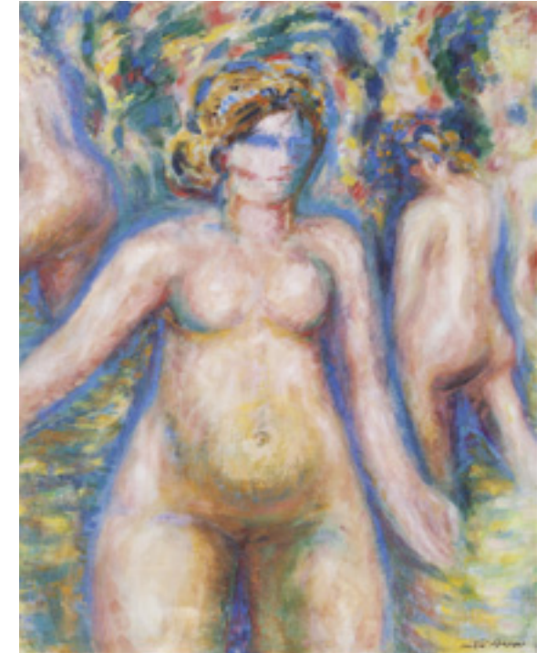
André Masson »Trois Nus«, 1950, Öl auf Leinwand, 65,5 x 50 cm